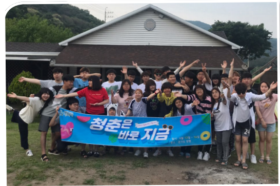
노틀담대학 MT “청춘은 바로 지금”