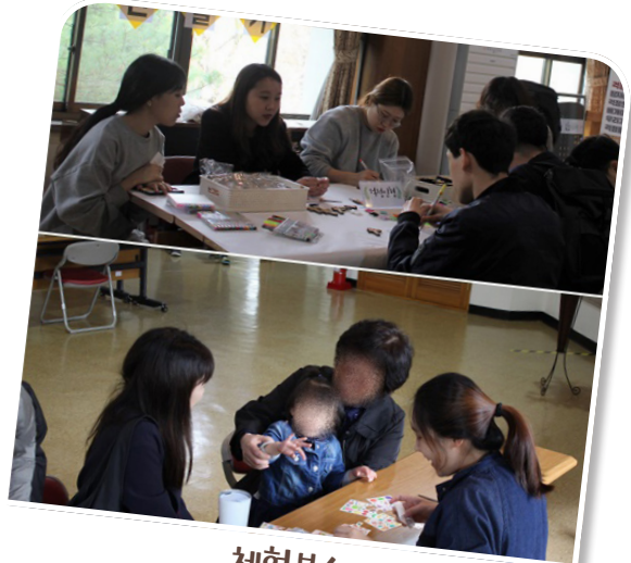
체험부스 (걱정인형만들기, 페이스페인팅, 포토존)