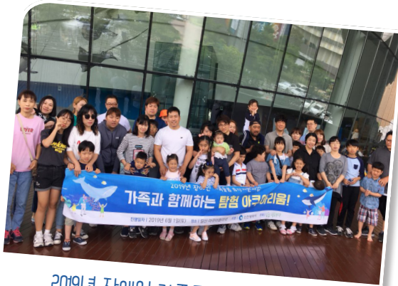
2019년 장애인 가족돌봄휴식지원사업 “가족과 함께하는 신나는 해양생태 체험”