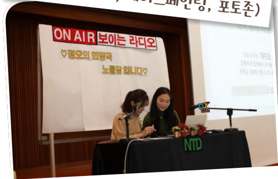
보이는라디오 경오의 희망곡, 노틀담입니다