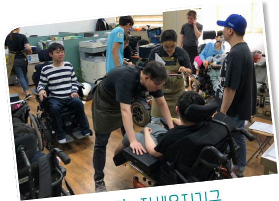
찾아가는 자세유지기구 그룹방문서비스 시행