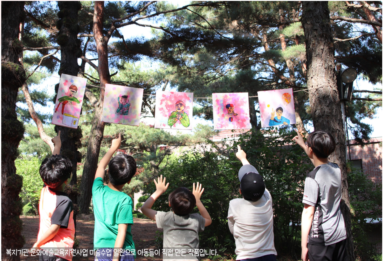
복지기관 문화예술교육지원사업 미술수업 일환으로 아동들이 직접 만든 작품입니다.