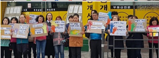
장애인식개선 거리 캠페인