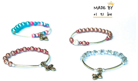
“지혜 팔찌” 능력개발팀 pcc 이용자 이지혜님이 제작한 팔찌입니다.